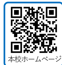
本校ホームページ