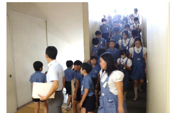
【不審者の場所を避けて無言で体育館へ移動する様子】

6月9日(水)に、校内に侵入した不審者への対応の仕方や教室内への侵入を未然に防ぐための手立てについて知り、安全・迅速な行動につなげることができるようにするために、鹿児島市安心安全課職員を招聘して不審者対策対応訓練を実施しました。子供たちは、不審者がいる場所と避難経路を関係付けながら、どのように対応したり避難したりすることが最良の方法か考えることができました。