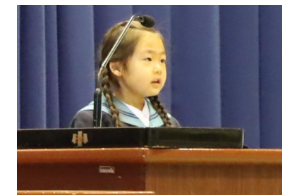
【入学式で誓いのことばを語る1年生児童】

また、8日（水）には、入学式が行われ、97名の新入生を迎えました。新しい学校生活に胸をはずませながら、笑顔で入場する新入生の姿がとても印象的でした。式では、6年生の代表児童が、新1年生に向けてお祝いの言葉を贈るとともに、附属小学校のよさなどについて優しく語りかけることで、新入生も安心した表情を見せていました。新入生代表児童は、多くの来場者を前に、はきはきとした声でしっかりと誓いの言葉を述べることができました。